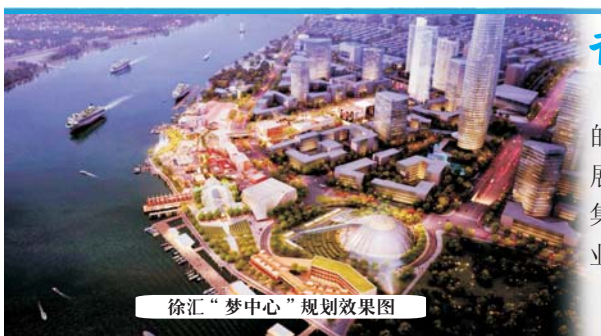
徐汇“梦中心”规划效果图

打造杨浦创业品牌 区科技企业总数累积达5400余家。1—9月，科技园区新增注册大学生创业企业133家，其中10家获上海市大学生创业基金。全球杰出青年社区首个中国分社区落户杨浦园。“3310”计划累计吸引78名入选国家“千人计划”的海外高层次人才和324家海外人才创业企业。中国（上海）创业者公共实训基地累计孵化企业167家，预孵化项目188个。