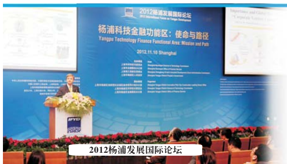
2012杨浦发展国际论坛