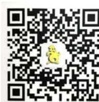
上海科普微信服务号二维码