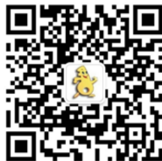
上海科普微信服务号二维码

坚持政府引导和社会参与、公益推进与市场运作相结合，整合资源，创新机制，努力提升公民科学素质，营造“大众创业、万众创新”的文化氛围。建立兼具“开放性”的科普活动模式，形成以市级大型活动为重点、各系统专题活动为辅助、社区各类经常性活动为基础，紧扣主题、形式多样、优势互补、协调发展的科普活动格局；构筑凸显“包容性”的科普场馆体系，完善现有科普场馆产业和行业布局，提升已建科普场馆和基地功能，扶持引导企业、基金会等社会力量投入科普场馆建设；打造具有“辨识度”的科普传播网络，在强化科普内容科学性的同时，提升科普传媒的影响力，积极发展上海科普微信、微博、App等科技传播新载体建设，推动公众对科技的关注和参与。